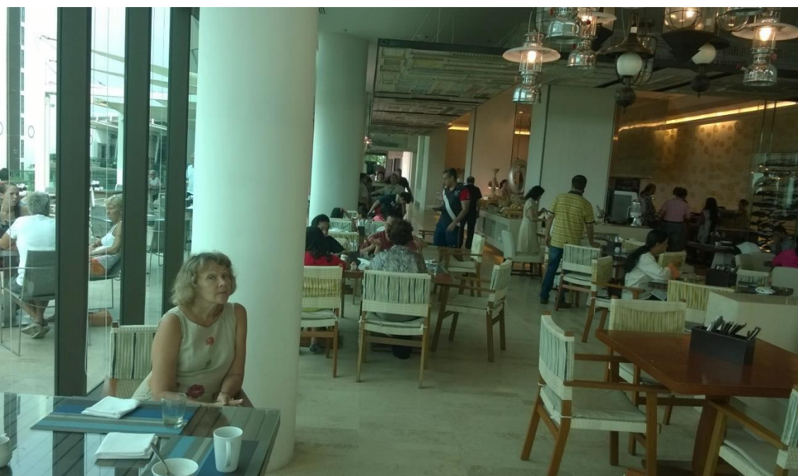
Aamiaishuoneessa lamput olivat erityisasemassa.