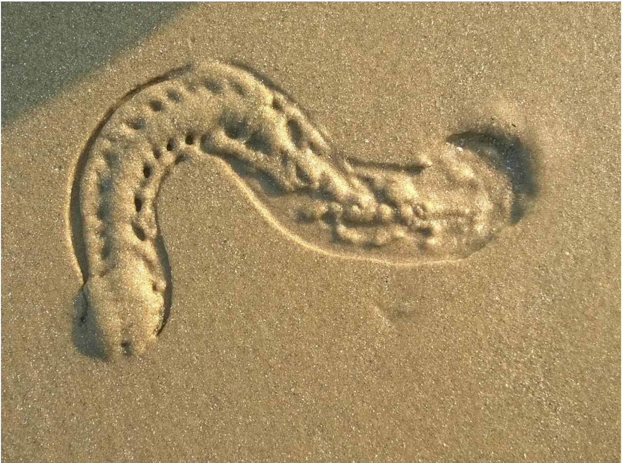
Törmäsimme rannalla varsin mielenkiintoisiin olioihin. Tätä kirjoittaessani en vielä tiedä mikä tuo simpukan oloinen otus on. Ettei vaan olisi jokin simpukka? Näitä oli rannalla vierä vieressä, paljon!