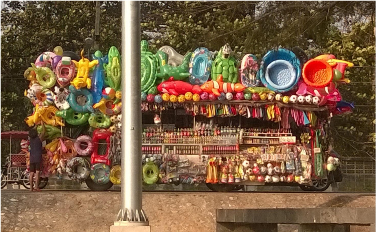
Tämä oli varsin veikeä myymäläauto. Mistä niitä asiakkaita oikein riittää???